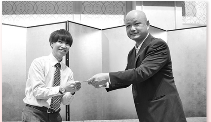
委員長賞を贈呈する五木田中央執行委員長